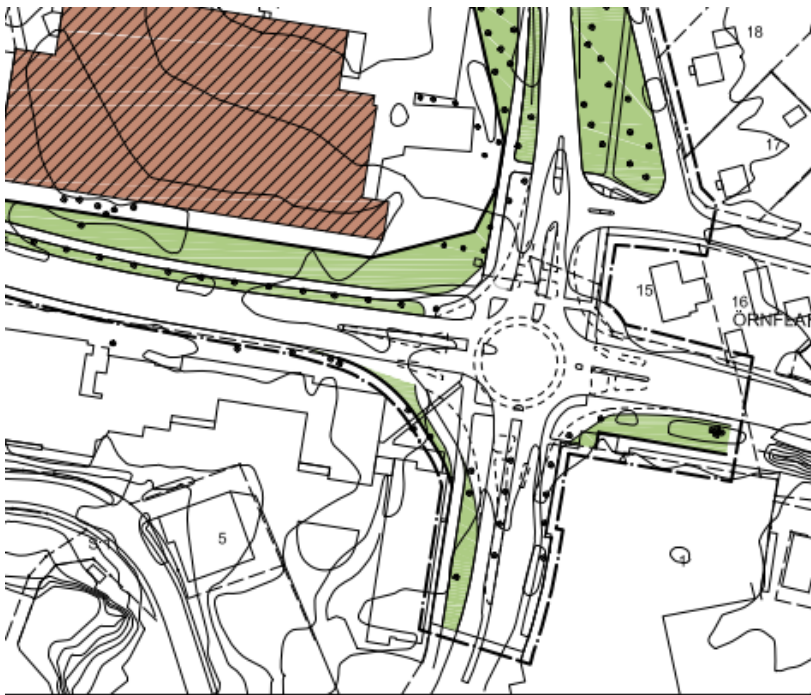
Figur 2 – utformningsförslag